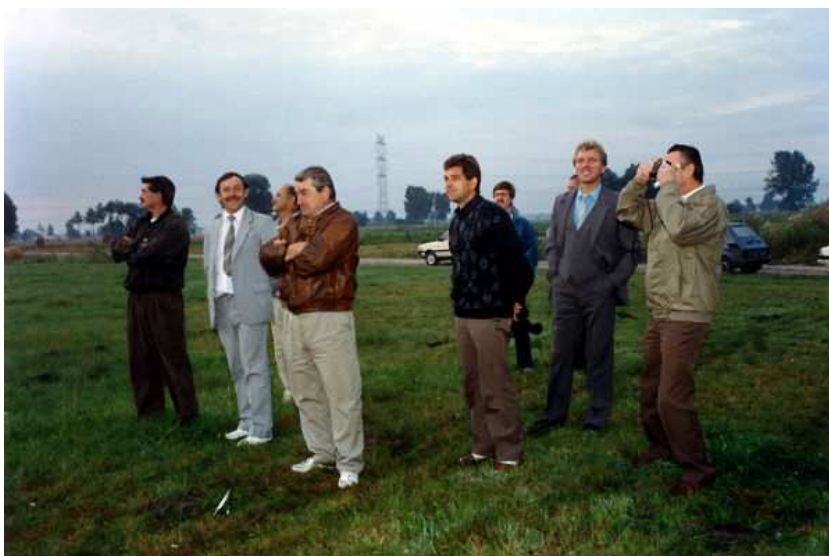
Delegacje z Radzyna i Łomży obserwują gołębie w 1991 r.

Dla nas hodowców z Oddziału Łomża Miasto lot radzyński nadal jest ze wszystkich zaplanowanych (jest ich około osiemnastu) wyczekiwany i najważniejszy. I tak niech zostanie do końca świata i o jeden dzień dłużej, jak mówi słynny klasyk Jerzy Owsiak z Wielkiej Orkiestry Świątecznej Pomocy.