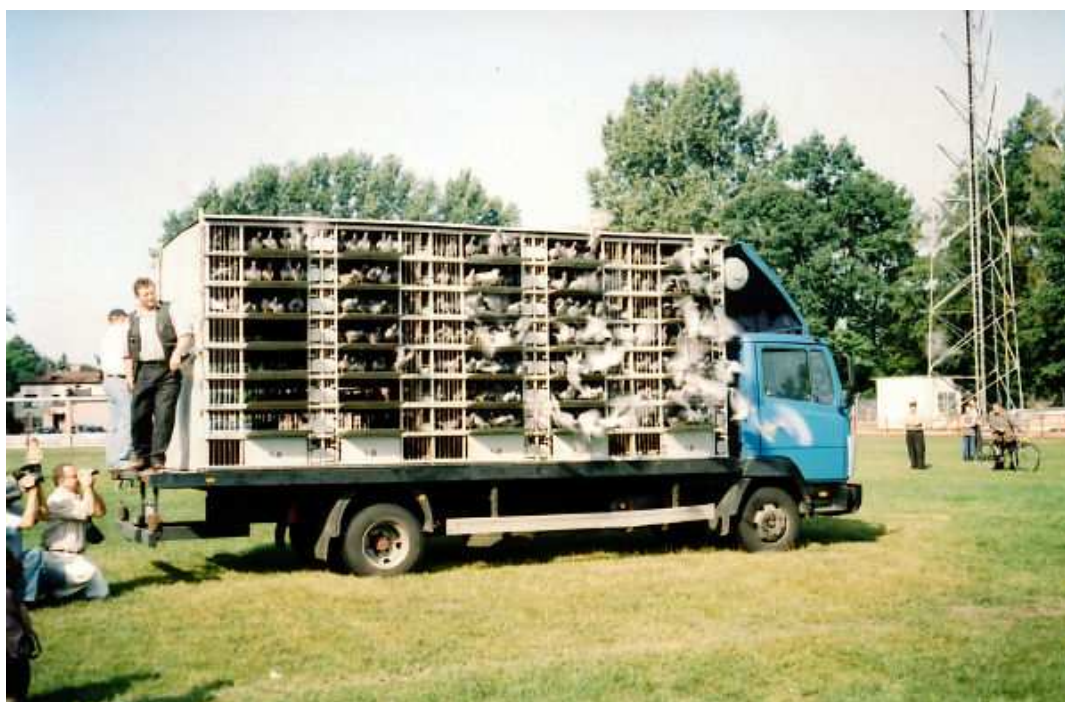
Start gołębi w Radzynie