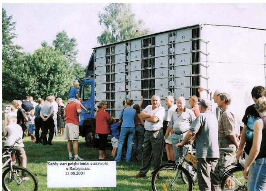
Liczni widzowie obserwują kabiny z gołębiami

Hodowcy gołębi sportowych szanując już długoletnią tradycję i czcząc krwawe boje, jakie stoczył 33. Pułk Piechoty z Łomży pod Radzyminem każdego roku, w dniu 15 sierpnia biorą udział w odbywających się tam centralnych uroczystościach, w których uczestniczą najwyższe władze państwowe.