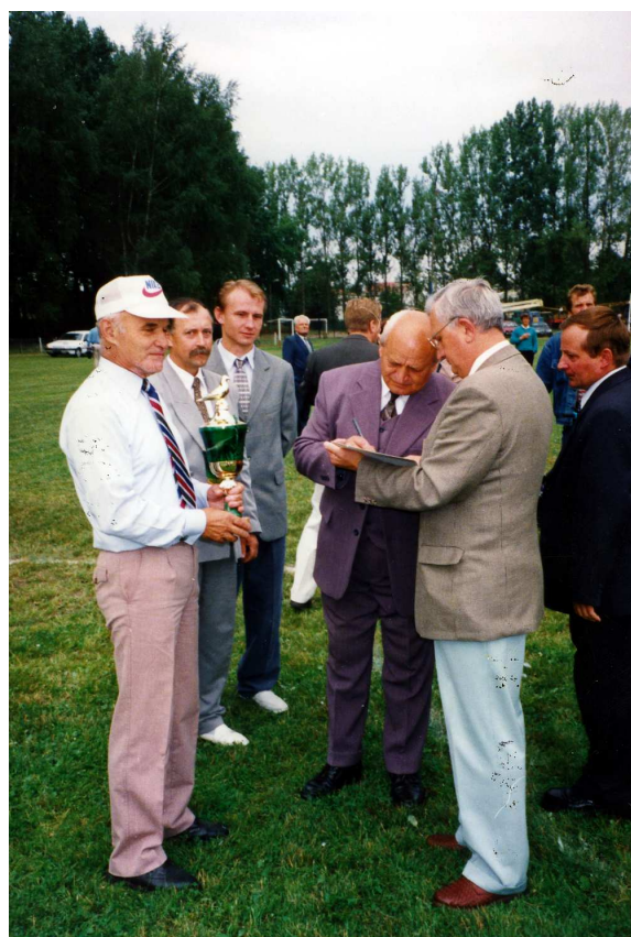
Delegaci z Łomży otrzymują nagrody z rąk Rady Miejskiej Radzymina

Przez okres dwudziestu lat uczestnictwa gołębi z ziemi łomżyńskiej w uroczystościach radzyminskich w dniu 15 sierpnia ukazały się liczne artykuły w prasie regionalnej i ogólnokrajowej. Moment lotu gołębi w Radzyminie tego dnia ukazywały liczne stacje telewizyjne, regionalne w Białymstoku i Łomży. Można było przeczytać też w miesięczniku „Hodowcy Gołębi Poczтовых” na temat upamiętnienia i uatrakcyjnienia tych patriotycznych uroczystości przez wypuszczenie do lotu konkursowego gołębi młodych z Oddziału Łomża Miasto.