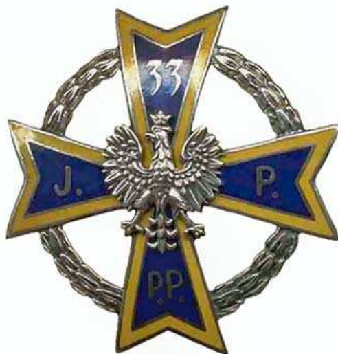
Odznaka 33. Pułku Piechoty z Łomży z 1929 r.

Przyczynił się On walnie do wiktorii radzyńskiej. Z tego pułku poległo 456 żołnierzy, co szósty żołnierz oddał swoje życie tu pod Radzyminem i nie możemy o tym zapomnieć.