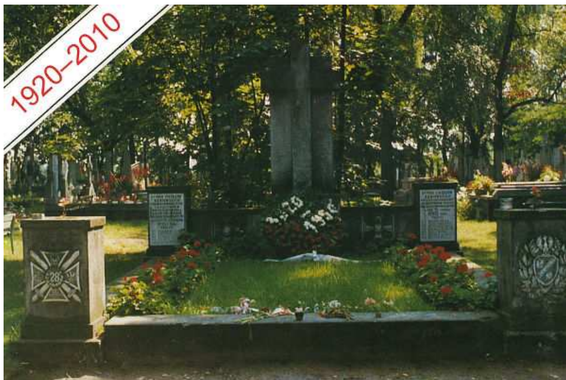
Cmentarz Żołnierzy Polskich – 1920 r., Radzymin. Bratnia mogiła żołnierska

Przyczynił się On walnie do wiktorii radzyńskiej. Z tego pułku poległo 456 żołnierzy, co szósty żołnierz oddał swoje życie tu pod Radzyminem i nie możemy o tym zapomnieć.