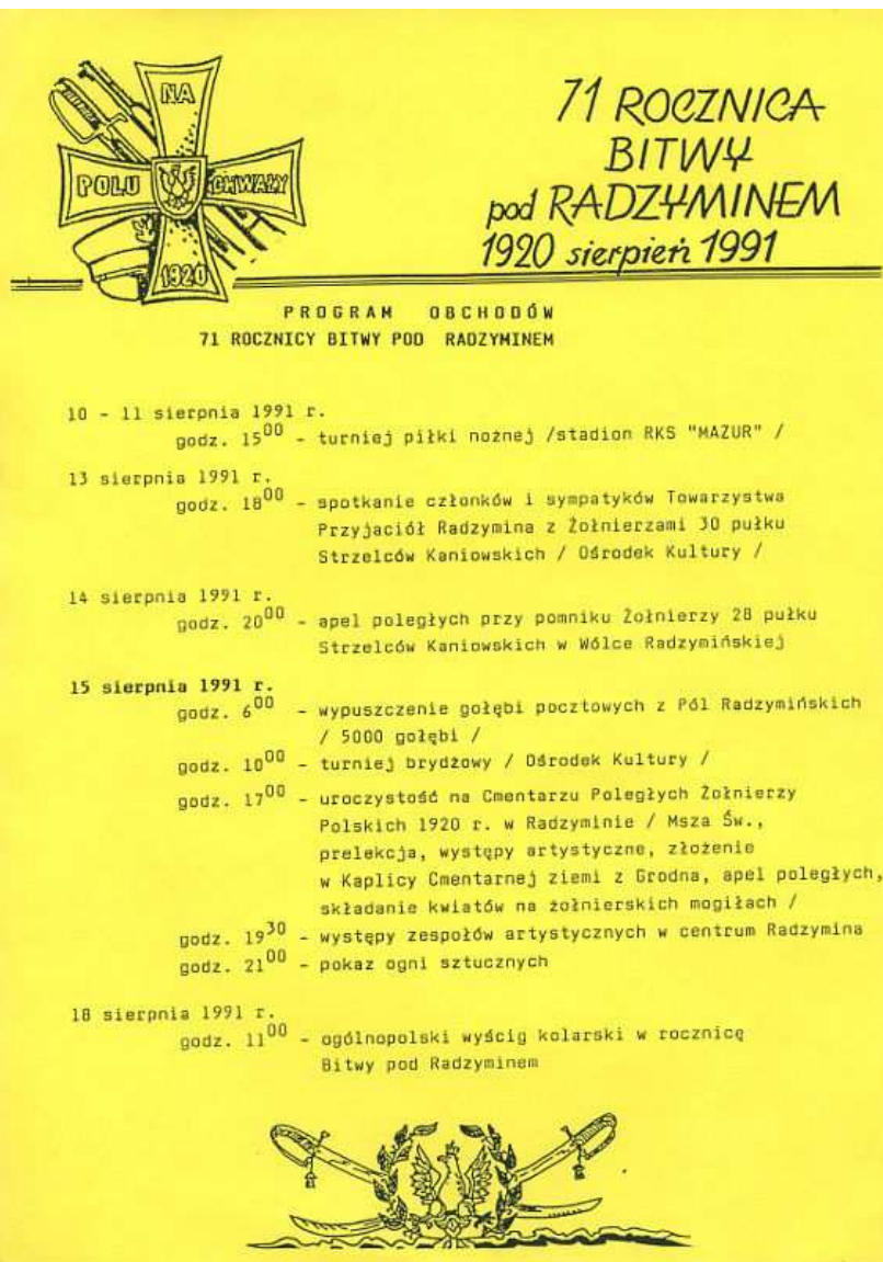
Pierwszy plakat w powojennej Polsce informujący o uroczystościach 15 sierpnia