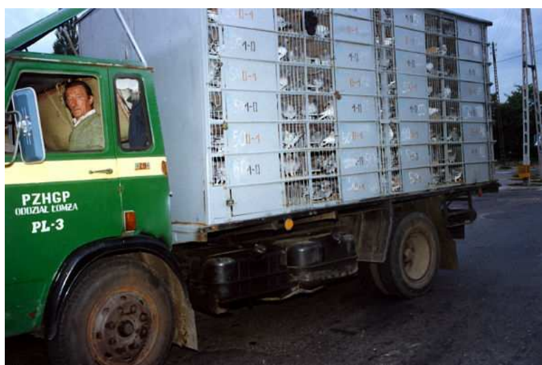
Kabina łomżyńska z gołębiami na ulicach Radzymina w 1991