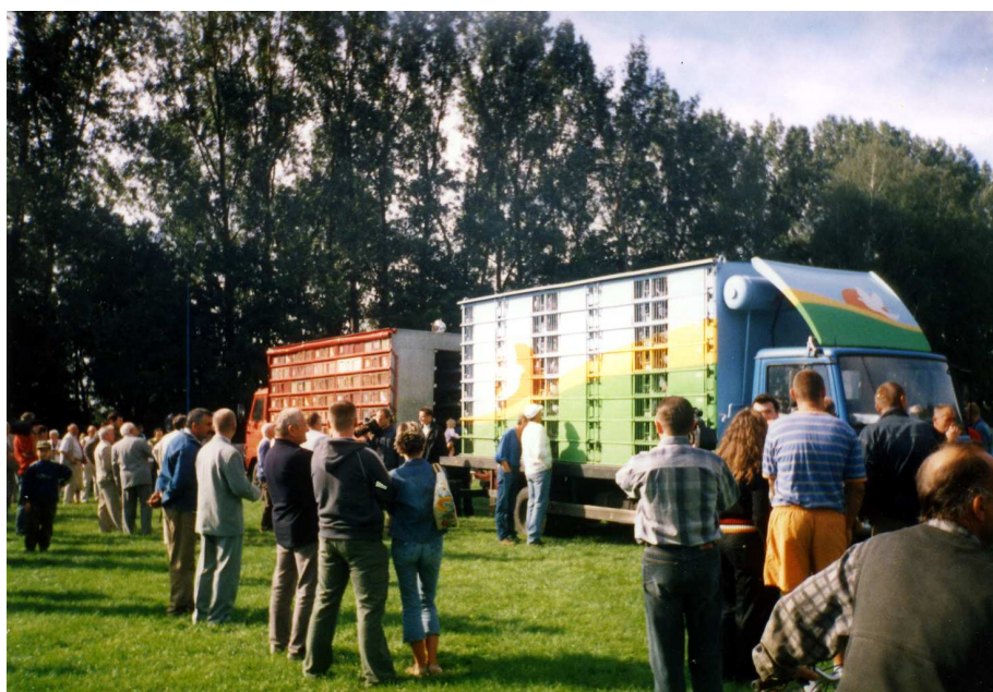
Zdjęcie dwóch kabin, jedna z Ostrołki, druga z Łomży