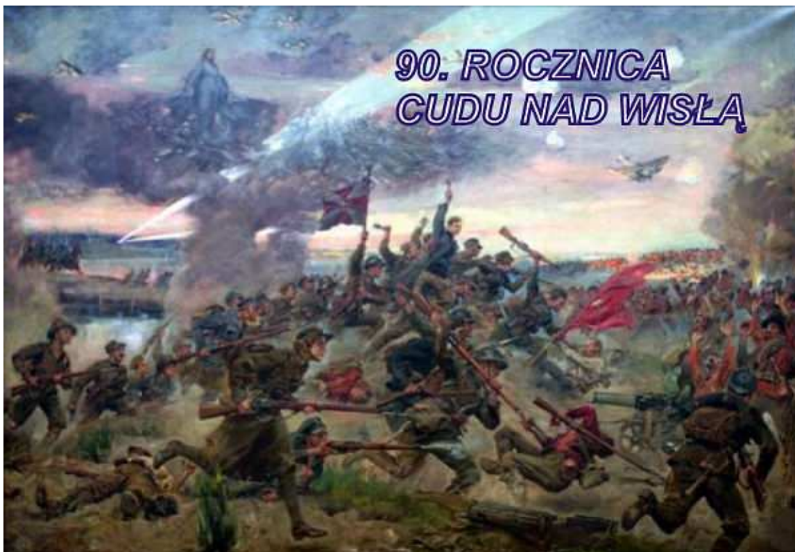
Juliusz Kossak – Bój o Radzymin

Nadszedł słynny miesiąc sierpień. Miesiąc pamięci narodowej.